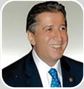
Köksal Toptan Başkan