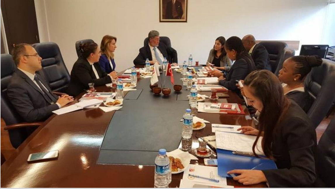
Fotoğraf: African Peer Review Mekanizma heyetinin çalışma ziyareti – 26 Ekim 2017 Ankara

Bu kapsamda; 26 Ekim 2017 tarihinde African Peer Review Mekanizma'nın CEO'su Sayın Prof. Eddy MALOKA ve personeli tarafından deneyim paylaşımı amacıyla Kurulumuza bir ziyaret gerçekleştirilmiştir.