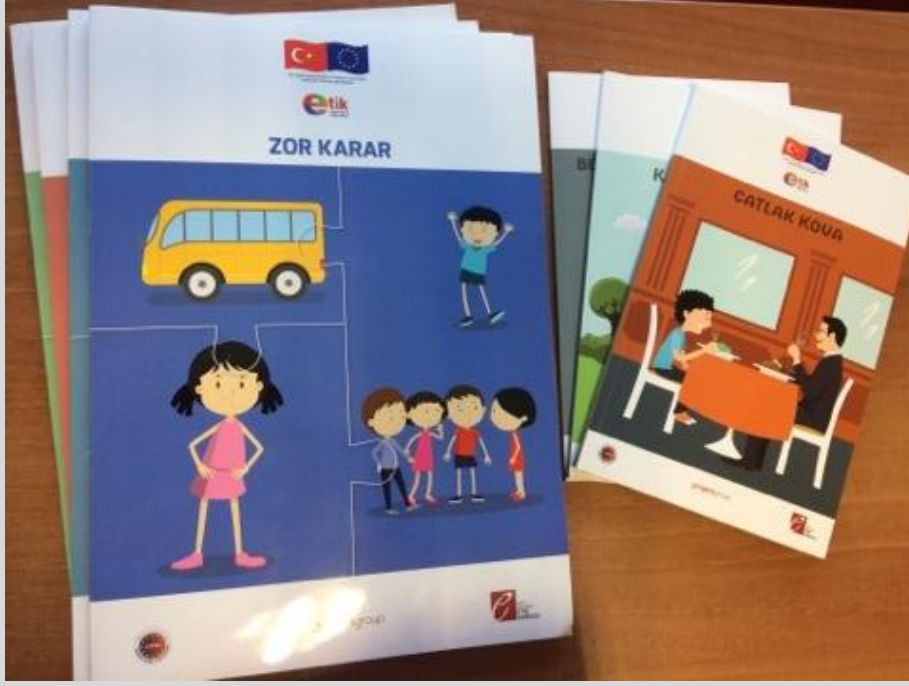
Fotoğraf: Farkındalık materyali; örnek hikâye kitapları – 2017 Ankara

İlkokul (6-9 yaş) ve ortaokul (10-14 yaş) öğrencileri için etik değerleri vurgulayan hikâye kitaplarının konunun uzmanları tarafından hazırlanması amacıyla; Kurulumuzun koordinasyonunda ilgili tarafların katılımları ile ilki 9 Kasım 2016 tarihinde gerçekleştirilen çalıştayın devamı niteliğindeki ikinci çalıştay ise 21 Şubat 2017 tarihinde Limak Ambassadeur Hotel’de düzenlenmiştir.