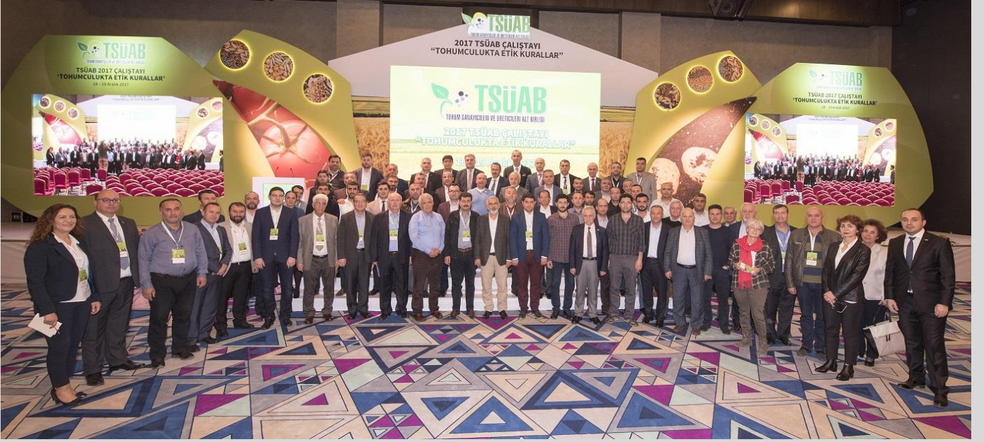
Fotoğraf: 2017 Yılı TSÜAB Uluslararası Tohumculuk Çalıştayı – Aralık 2017 Antalya