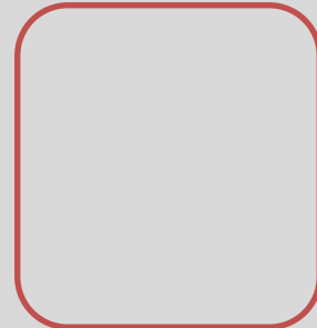
Üye (E. Sayıştay Üyesi)