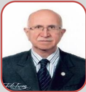
Ömer KOÇAK Üye (E. Yargıtay Üyesi)